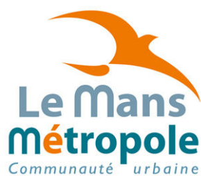
Schéma de mutualisation des de services 2014-2020